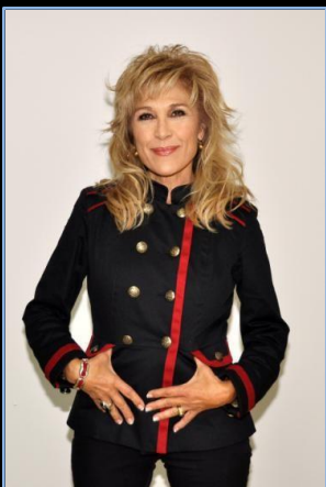
canción de Valladolid.